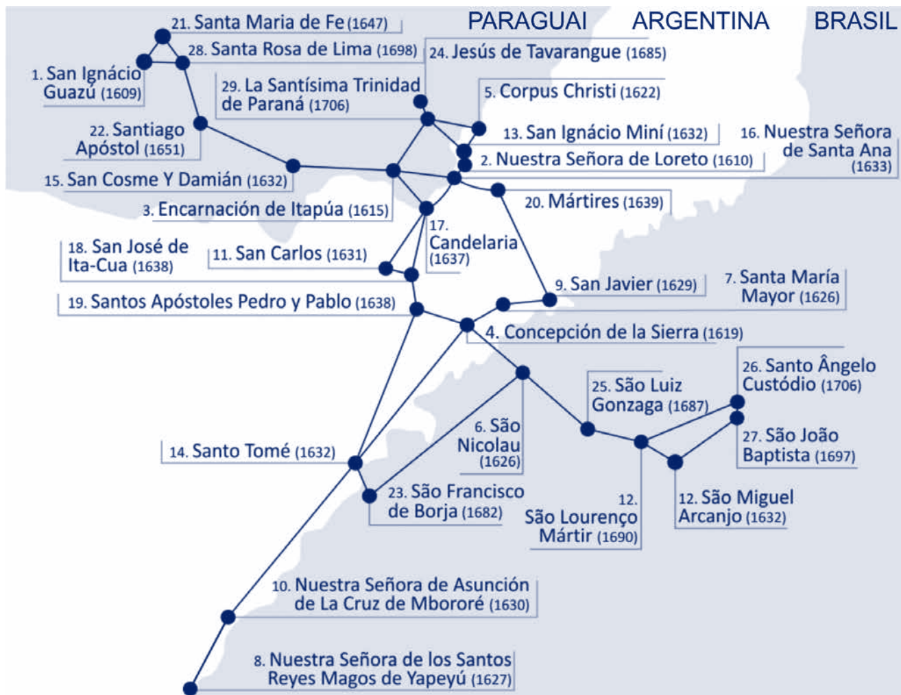
Figura 1: Os trinta aldeamentos que formaram a antiga Província Jesuítica do Paraguai. (Elaborada pelas autoras.)

Como mostrado na Figura 2 (na próxima página) à direita, entende-se que as tecnologias digitais possibilitam uma forma diferente de comunicação, em que os diversos agentes envolvidos tenham um melhor contato entre si e com a informação produzida. Dessa forma, é possível potencializar o uso da informação e sua divulgação; promover a criação coletiva de conhecimento (como o filósofo da informação francês Pierre Lévy já afirmava em 1999); estreitar laços entre profissionais, instituições e comunidade glocal; promover a colaboração e a conversa entre os países sobre estas atividades e em relação ao patrimônio compartilhado; e valorizar o patrimônio cultural em comum. Retomando a noção histórica