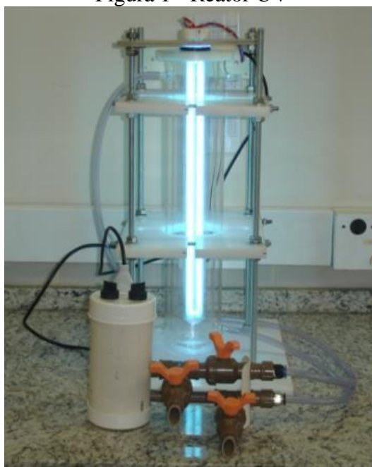
Figura 1 - Reator UV

Os ensaios foram realizados em triplicata, sendo que as concentrações de H 2 O 2 utilizadas foram: 2500 mg/L, 1500 mg/L e 500 mg/L. Os dados de Cor Aparente e Verdadeira foram analisados para cada triplicata, os resultados compilados em Planilha Eletrônica para melhor visualização e análise. A figura 1 mostra a fotografia do reator fotoquímico e seus aparatos.