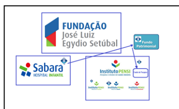
Imagem 1: governança da FJLES

Foi construído um hospital infanto-juvenil, com 110 leitos e para ser a referência em pediatria na medicina suplementar na cidade de São Paulo. O resultado financeiro deste hospital seria usado inicialmente para pagar as dívidas de R$100 milhões e depois para alimentar um Fundo Patrimonial que será responsável para garantir a perenidade da Fundação e de fomentar as pesquisas, a educação e os projetos sociais, sempre na Saúde Infantil.